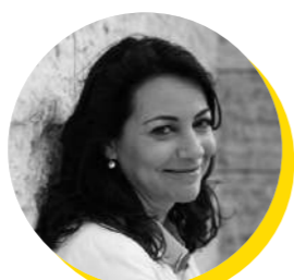
Sofia Colares Alves Diretora para Administrative Capacity Building and Programme Implementation II da DG REGIO, Comissão Europeia