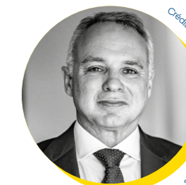
Bernardo Ivo Cruz Secretário de Estado da Internacionalização