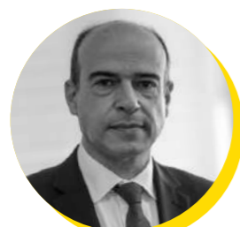
Pedro Chaves de Faria e Castro Subsecretário Regional da Presidência do Governo dos Açores