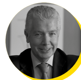
António Saraiva Presidente da CIP – Confederação Empresarial de Portugal