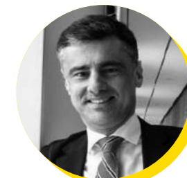
Tiago Antunes Secretário de Estado dos Assuntos Europeus