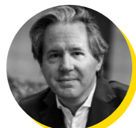
Pedro Lourtie Embaixador, Representante Permanente de Portugal junto da União Europeia