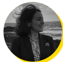
Isabel Carvalhais Deputada, Parlamento Europeu