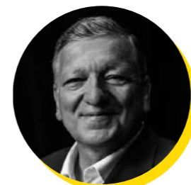
José Manuel Durão Barroso Presidente da Aliança Global para as Vacinas (GAVI)