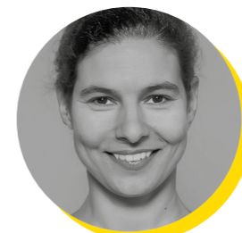
Mónica Silveiras Editora, ECO