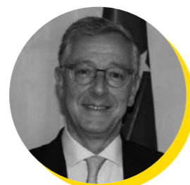
João Aguiar Machado Embaixador, Missão da União Europeia junto da Organização Mundial do Comércio (OMC)