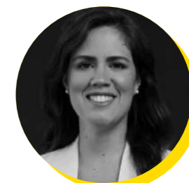
Lídia Pereira Deputada ao Parlamento Europeu e Presidente da Juventude do Partido Popular Europeu (YEPP)